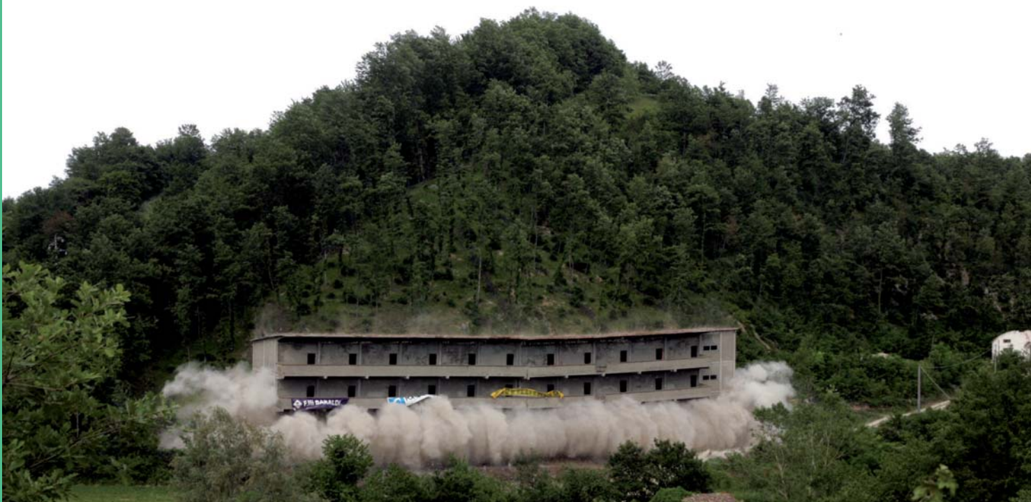
Il crollo dell'ecomostro

E' stato abbattuto l'ecomostro di Felina: si calcola che circa 10.000 persone abbiano assistito a questo storico evento; diverse mostre organizzate ed incontri con scrittori e registi; 43 appuntamenti di rassegne estive di musica e spettacolo; la Provincia ha continuato a produrre la newsletter "Biennale del Paesaggio" che contiene informazioni e notizie inerenti tutte le attività della biennale: gli iscritti hanno raggiunto quota 7.300.