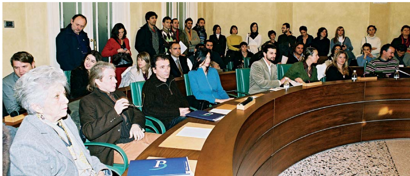
1 dicembre 2006 - Cerimonia di premiazione dei due concorsi di idee "Il paesaggio ritrovato" e "Paesaggi in movimento" presso la sede della Provincia di Reggio Emilia.

I progetti presentati ai concorsi di idee sono stati 120: 49 quelli dichiarati idonei.