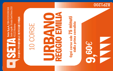
Biglietto multiplo orario 10 corse valido 75 minuti dalla convalida

In caso di neve, per il trasporto pubblico informazioni al numero SETA