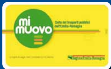
MI MUOVO CARD Abbonamenti mensili e annuali